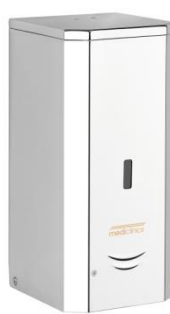
DJS0039AC acabado brillante