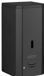
DJS0039AB Acabado negro mate