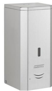
DJS0039ACS Acabado satinado