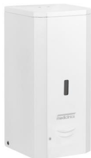
DJS0039A Acabado blanco